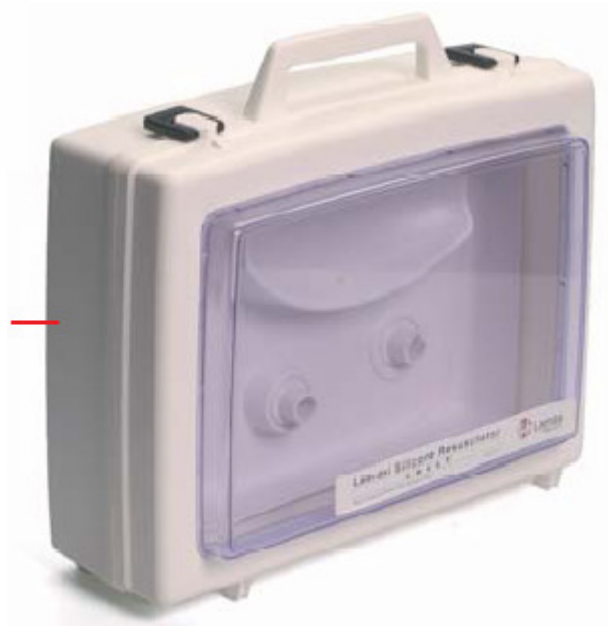
85 07 00 Display case cpl., Preterm