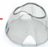
51 01 03 Cap for LSR Intake Valve (pkg. 3)