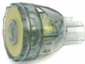
87 54 00 Intake/Reservoir Valve