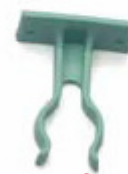
51 17 00 Wall bracket