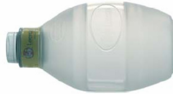
86 01 50 Paediatric Ventilation bag, 500 ml