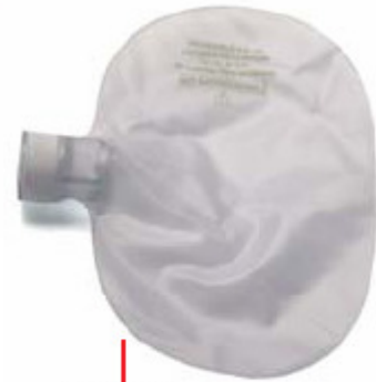
55 19 01 O 2 reservoir, 0.6 litre