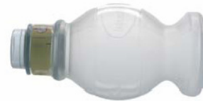
85 01 50 Preterm Ventilation bag, 240 ml