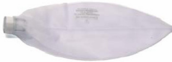
53 19 01 O 2 reservoir 2.6 litres