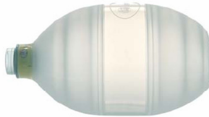
87 01 50 Adult Ventilation bag, 1600 ml