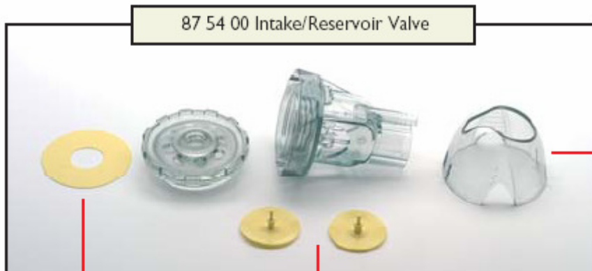
87 54 00 Intake/Reservoir Valve