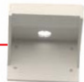
52 11 00 Wall mount, Preterm/Paediatric display case