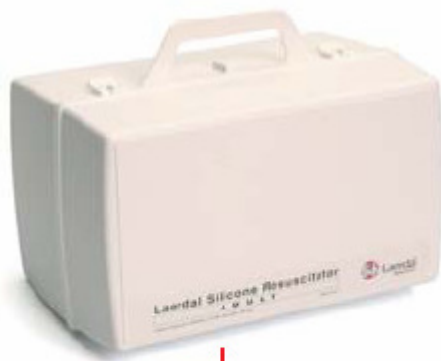
86 04 20 Compact case cpl., Adult