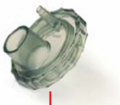
53 19 07 Intake Valve Adapter (23 mm OD)