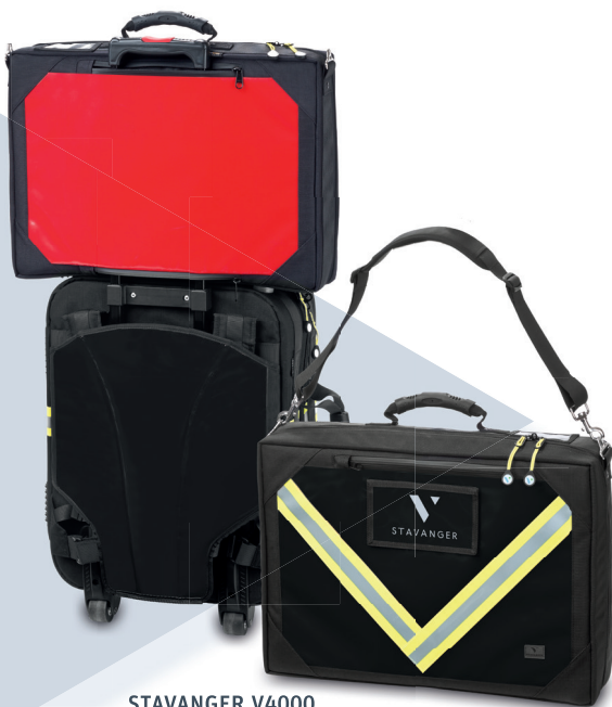
STAVANGER V4000 wahlweise in rot, schwarz und neongelb erhältlich

https://www.fleischhacker.biz/de/online-praesentationen